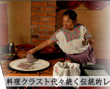
料理クラスト代々続く伝統的レシピ

メキシコの料理シーンは、間違いなくユニークです！伝統的なシェフは、訪問者を温かく歓迎し、伝統を共有します。