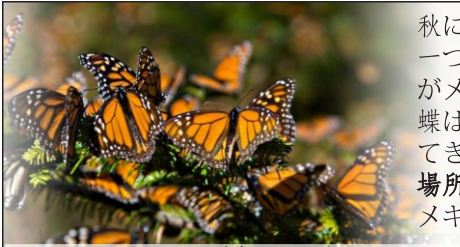
モナルカ蝶の回遊

秋には、最も美しいイベントの一つが始まります。モナルカ蝶がメキシコの森林に到着します。蝶は、米国・カナダ北部から渡ってきます。