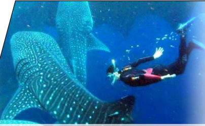
ジンベイザメと遊泳

毎年7月から8月にかけて、メキシコでは、ジンベイザメという巨大な訪問者を迎え入れます。ジンベイザメは、フィルターを通じて食事を市、ハンターではないため、一緒に遊泳するには非常に安全です。