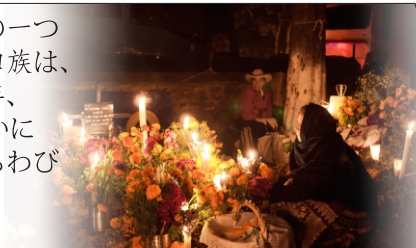
伝統的な死者の日