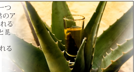
テキーラとメスカル