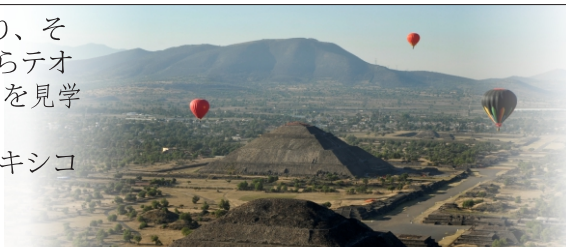
テオティワカン遺跡の気球