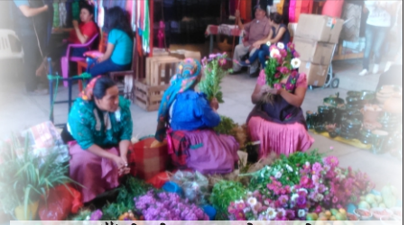
豊かなマーケット